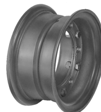
Dělený ráfek pro aplikaci pneumatik SOLIDEAL