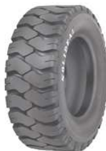
SOLIDEAL EXTRA DEEP