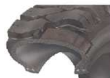
Řez vzdušnicovou pneumatikou SOLIDEAL

DUMPER - pro terénní aplikace, šípový vzorek, terénní Desty a stroje UNC