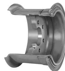
Ráfek Lemmerz pro aplikaci pneumatik SOLIDEAL